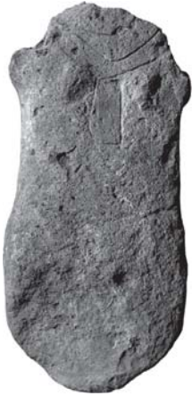
Պաշտամունքային արձան. Կարմիր բերդ

Պեղումներից հայտնաբերված ցլագլուխ և խոյազլուխ զարդաքանդակներով ծիսական օջախները, կենդանիների և մարդկանց արձանիկները յուրաքանչյուր բնակելի համալիրի անբաժան ուղեկիցներն էին: Սրանք վկայում են, որ, իրոք, Հայաստանի տարածքում ապրած մարդկանց կյանքում կրոնական պատկերացումներն ու ծիսական արարողություններն էական դեր են խաղացել: