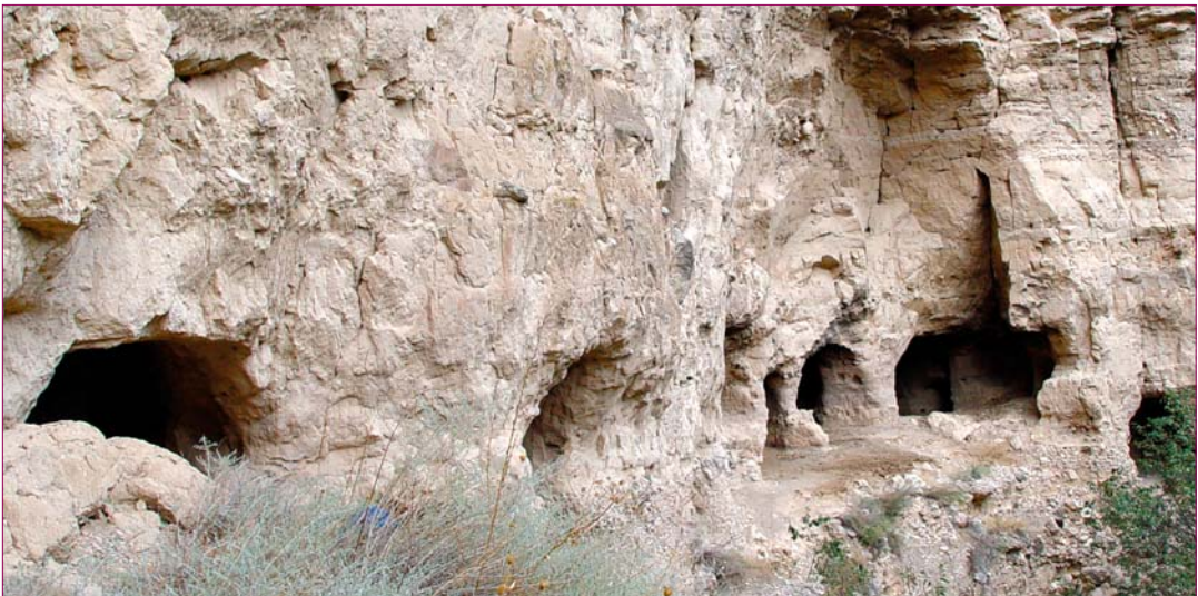
Հնագույն մարդու քարայր-կացարան. Բերձոր

Հայաստանի տարածքում հայտնի է վերին հինքարիդարյան շուրջ 60 հուշարձան: Դրանց հիմնական մասը լեռնաշխարհի հյուսիսարևելյան, հարավային և հարավարևմտյան մասերում է՝ Եփրատի ավազա-