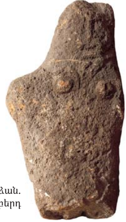
Պաշտամունքային արձան. Կարմիր բերդ

ներին: Յուրաքանչյուր տոհմ ուներ իր սրբազան կենտրոնը: Այստեղ պահպանվում էին տոհմական մատուքները, և կատարվում էին զանազան ծիսակատարություններ: Տոտեմիզմը արտահայտում էր տոհմի անդամների և բնական միջավայրի հետ սերտ կապը: