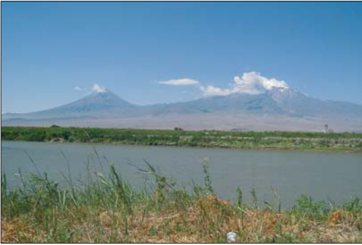
Մեծ ու Փոքր Մասիսները և Արաքս գետը