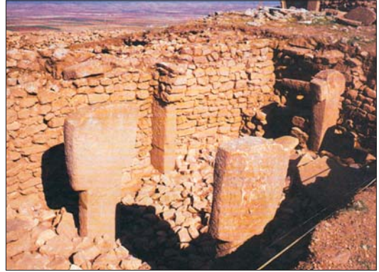
Տաճարային համալիր. Արևմտյան Հայաստան

Բնակլիմայական խոշոր փոփոխությունները, որոնք ավարտվեցին շուրջ 10 հազար տարի առաջ, արմատապես փոխեցին մարդու կենսագործունեության պայմանները: Միջին քարի դարը և նոր քարի դարի սկզբնափուլը, ինչպես վերը նշվեց, նախապատրաստեցին հասարակական զարգացման կտրուկ վերընթացը նոր քարի դարի մնացած ժամանակաշրջանում: Ք.ա. X-VIII հազարամյակներում սկզբնա-