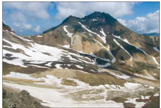
Արագած լեռան խառնարանը և հյուսիսային գագաթը

Հայկական լեռնաշխարհում կան բազմաթիվ խոշոր լեռնաշղթաներ: Հյուսիսում՝