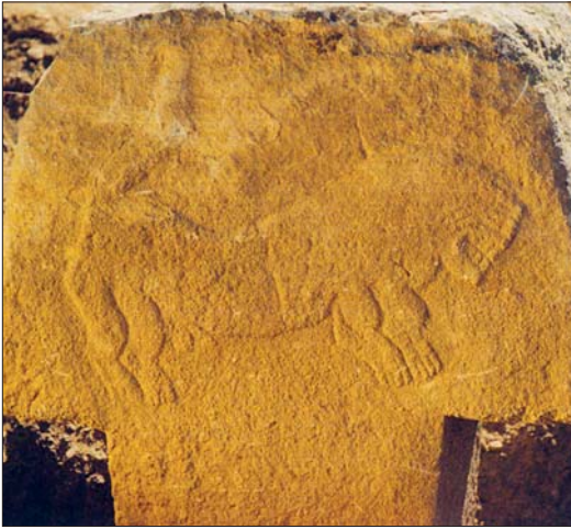
Ներքին հարդարանքի կոթող. Արևմտյան Հայաստան

թե որտեղ պետք է փնտրել այս մշակույթի ակունքները: 1990–ական թվականների առաջին կեսին Սասն ջուր գեղի արևմտյան ափին պեղված հնավայրի տվյալները եկան փաստելու, որ այստեղ կայուն բնակատեղիներ հիմնող առաջին համայնքները հանդես են գալիս արդեն Ք.ա. X հազարամյակից: