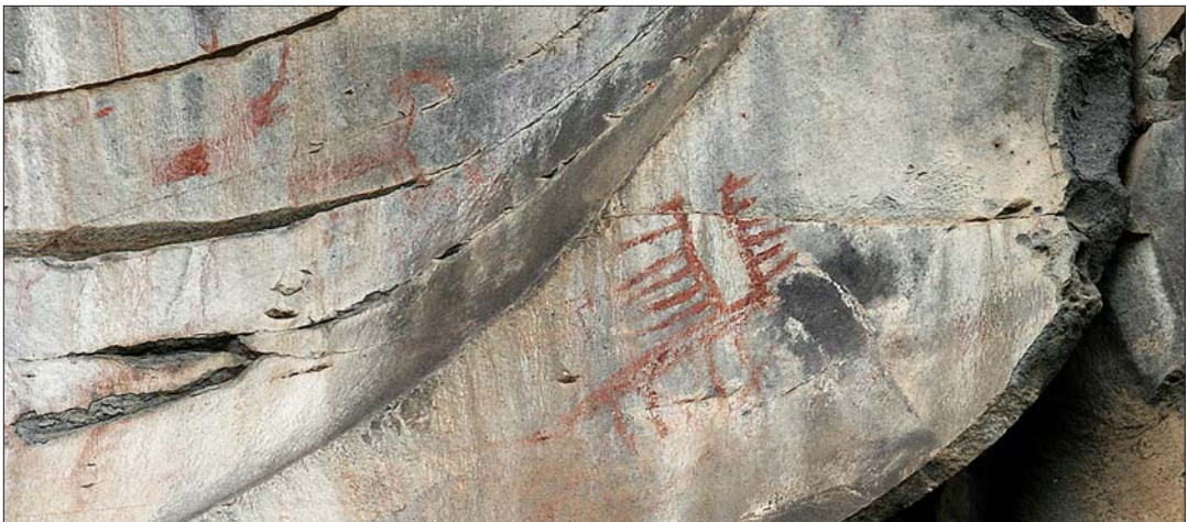
Ժայռապատկեր Գեղամավան-1 քարայրում

կյանքը, դրա բազմազան դրսևորումները, մահը և անդրշիրիմյան կյանքը բացատրում էին ոգու ներկայությամբ կամ բացակայությամբ: Հետզհետե սկզբնավորվում է նախնիների պաշտամունքը , հավատը տոհմի նախորդ սերունդների անդամների ոգիների հրաշագործ գործության նկատմամբ: Տոհմի, հետագայում նաև գերդաստանի, ազգի հիմնադիր նահապետները սրբացվում են : Յուրաքանչյուր համայնք, ընտանիք ուներ իր հովանավոր նախնին, որից սերվել էին իրենք: Մահացած տոհմակիցներին թաղում էին բակում՝ տան շեմին կամ հատակի տակ, որպեսզի մահացած ազգականի ոգին չլքեր իրենց: