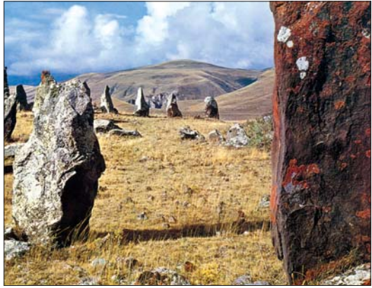
Ջորաց դաշտի մենհիրները

կյանքը, դրա բազմազան դրսևորումները, մահը և անդրշիրիմյան կյանքը բացատրում էին ոգու ներկայությամբ կամ բացակայությամբ: Հետզհետե սկզբնավորվում է նախնիների պաշտամունքը , հավատը տոհմի նախորդ սերունդների անդամների ոգիների հրաշագործ գործության նկատմամբ: Տոհմի, հետագայում նաև գերդաստանի, ազգի հիմնադիր նահապետները սրբացվում են : Յուրաքանչյուր համայնք, ընտանիք ուներ իր հովանավոր նախնին, որից սերվել էին իրենք: Մահացած տոհմակիցներին թաղում էին բակում՝ տան շեմին կամ հատակի տակ, որպեսզի մահացած ազգականի ոգին չլքեր իրենց: