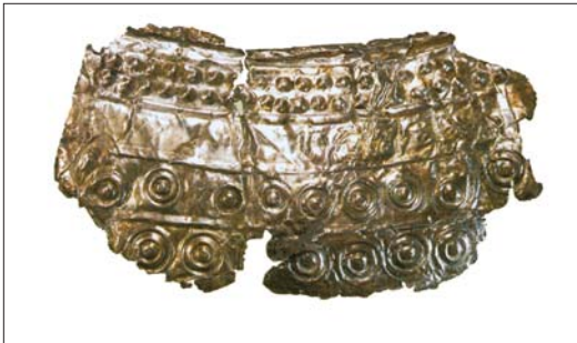
Ք.ա. III հազ. ոսկյա և արծաթյա զարդեր

Ք.ա. III հազարամյակի երկրորդ կեսում հասարակական զարգացումները լեռնաշխարհում նոր բովանդակություն և որակներ են ստանում: Արմատավորում են նախորդ ժամանակաշրջանի համար ոչ բնորոշ իրողություններ: Դրանք առաջին հերթին վկայում են հնագույն հայաստանաբնակների հասարակական, տնտեսական, ընկերային կյանքում տեղ գտած ծավալուն տեղաշարժերի մասին: