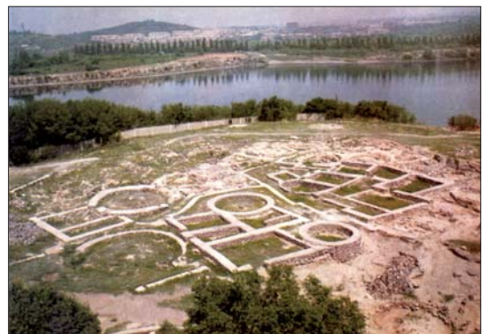
Շենգավիթ բնակավայրի ընդհանուր տեսքը. Ք.ա. IV–III հազ.

Հիշյալ տեղաշարժերն ընթացել են լեռնաշխարհի կենտրոնական գոտուց դեպի Արձեշ (Առնիստ)–Մուշ–Մալաթիա ուղիով: Արարատյան դաշտին և հարակից շրջաններին բնորոշ մշակութային իրողությունները տիրապետող են դառնում Բարձր Հայքում՝ ձգվելով Եփրատով դեպի հարավ՝ մինչև Մալաթիա և Խարբերդի դաշտ, Մշո դաշտում և Վանի ավազանում՝ ձգվելով դեպի արևելք՝ մինչև Ուրմիայի հյուսիսային և հյուսիսարևմտյան ափամերձ գոտիները: Շենգավիթյան մշակույթի արևելյան սահմաններն այսօր տեսանելի են Փոքր Կովկասի երկայնքով՝ Դերեդի և Աղստևի հովիտներից մինչև Արաքս: