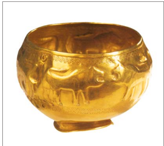
Ոսկյա գավաթ՝ առյուծի պատկերներով. Վանաձոր, Ք.ա. III հազ. վերջ

Ք.ա. XIX–XVIII դարերում՝ «Թռեղք-վանաձորյան մշակութային ընդհանրության» սահմաններն արևելքում ձգվում են Շիրվանի տափաստանից դեպի հարավ՝ մինչև Ուրմիայի արևմտյան ափամերձ շրջանները, այնուհետև Մեծ Կովկասի հարավային ստորոտից (ներառելով Արևելյան Վրաստանը, Կուր-Արաքսի ավազանը) հասնում Վանա լճի արևելյան և հյուսիսային ավազանը: Արևմտյան սահմանագոտին տեսանելի է Մուշ, Էրզրում, Արդվին գծով: Նշված տարածքները «Թռեղք-վանաձորյան մշա-